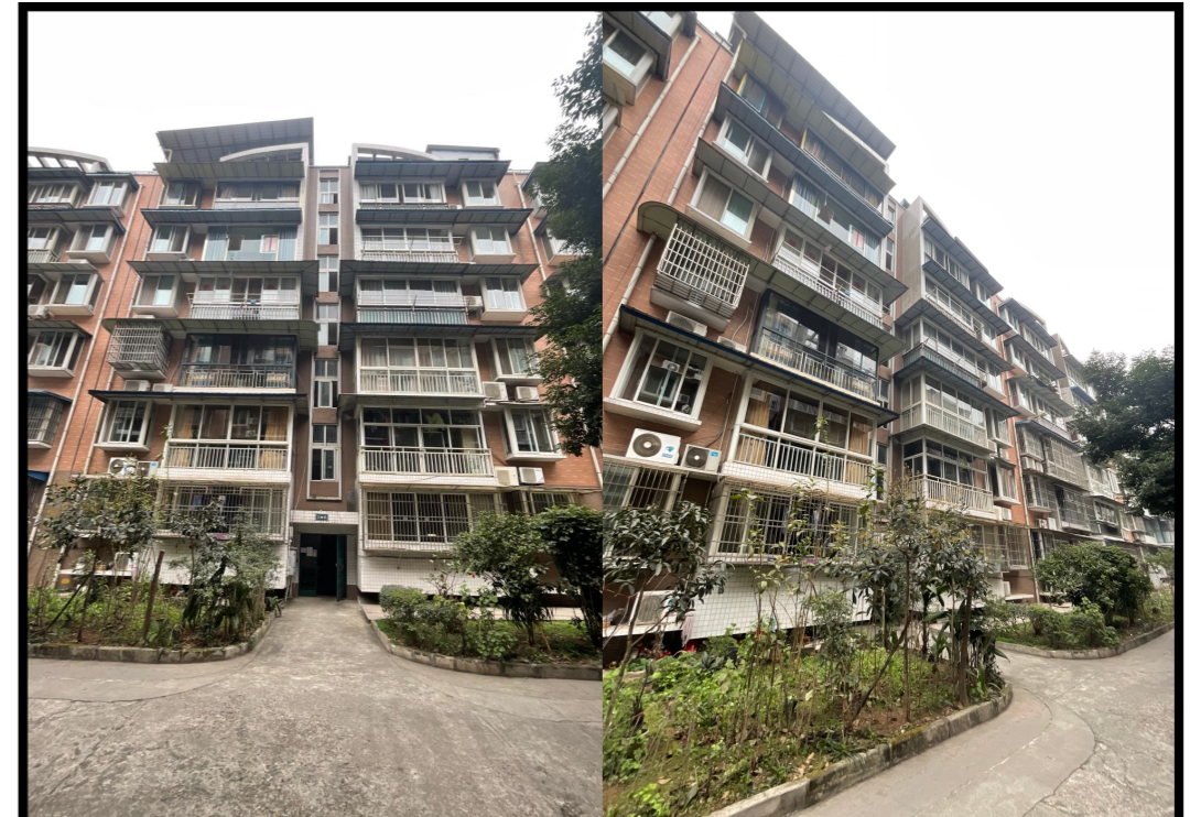
加装电梯前效果图