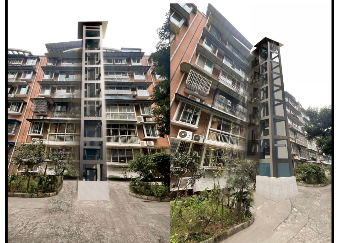
加装电梯后效果图